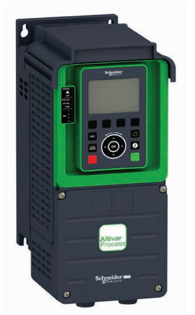
Variador de Velocidad Serie KRSP