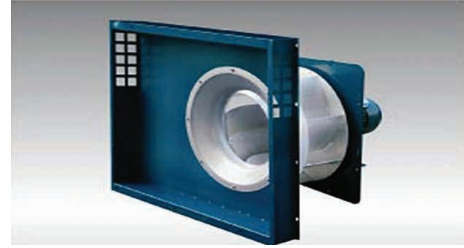
El ventilador de enfriamiento VFD proporciona ahorro de energía al reducir el flujo de aire durante períodos de carga ligera o bajas temperaturas.