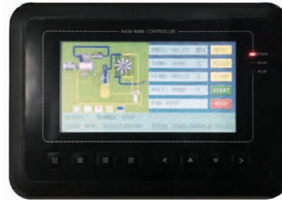
Gestión del Sistema de Panel de control serie KRSP

El panel de control contiene un microprocesador especialmente programado que puede controlar de forma segura y eficiente todas las funciones del compresor. La pantalla táctil monitorea la presión de línea, la temperatura de aceite y las condiciones de trabajo (modo carga, operación en vacío y parada). Las condiciones anormales activarán un LED parpadeante y un mensaje parpadeante indicando la causa de la alarma. Las funciones del microprocesador están protegidas por contraseña, accesibles solo para personal autorizado.