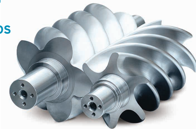
Conjunto de rotores Serie KRSP ‘los mejores en su clase’

El consumo de energía es un costo significativo a lo largo del ciclo de vida de un compresor, por lo tanto, es importante tener en cuenta el costo del ciclo de vida de un sistema de aire comprimido al evaluar las mejoras de productividad. Las características avanzadas de ahorro de energía de la serie KRSP reducen significativamente los costos operativos.