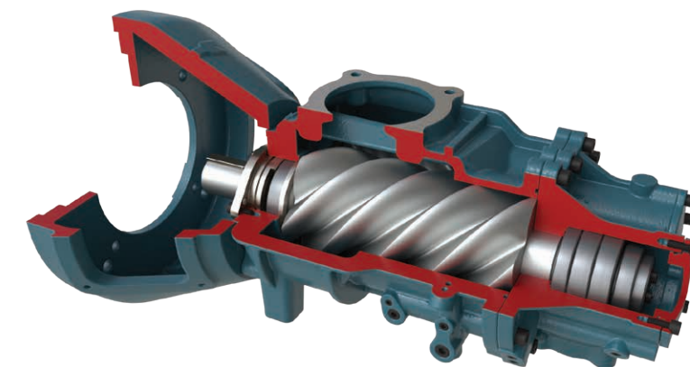
Unidad de compresión patentada Serie KRSP